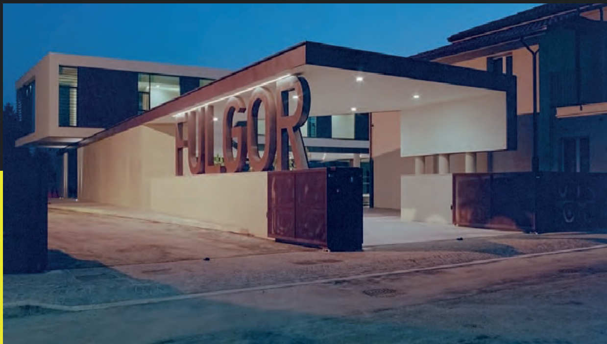
Centro Parrocchiale "Fulgor" Gambettola FC